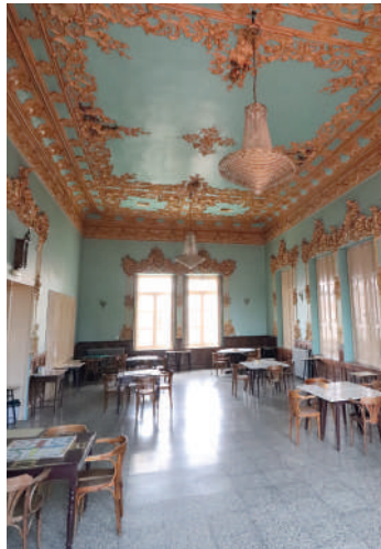
Foto interior casino

MI JUVENTUD. - Sin lugar el añadido a las fiestas de moros y cristianos tuvo influencia en el citado declive, aunque las Juntas del momento estuvieron batallando en cómo hacer resurgir la inquietud para que el Casino no decayera, la más significativa, fue adaptar los estatutos a una magnífica solución. Dejar que la mujer se desprendiera del artículo "de", es decir, la hija de, la mujer de, la esposa de, y la viuda de, todo ello referente al socio. Con todo merecimiento la mujer pasó