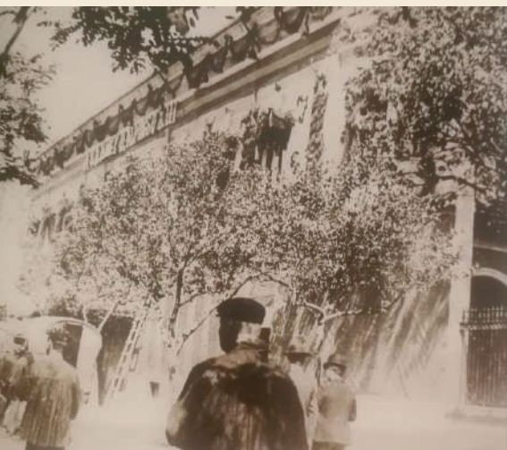
Fachada Casino Antiguo antes de la remodelación.

En un contexto sociológico, la necesidad de espacio de sociabilidad y de comunicación entre los elementos de las nuevas clases poderosas: burguesía y los nobles, constituyen foros de tertulia, epicentros de debate y conversación, que complementa una oferta recreativa recogida en estas sociedades de casinos y círculos convirtiendo en espacios decisivos para el