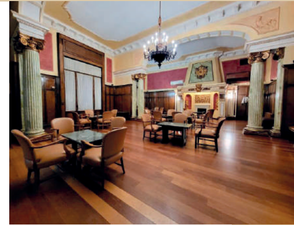
Salón de la Chimenea.

Una petición a todos los socios del Casino de Novelda y vecinos del municipio, mantengan vivo con su presencia y vinculación el latido del Casino, porque la Sociedad necesita también disfrutar de toda cuanta Cultura apoyan estas entidades.