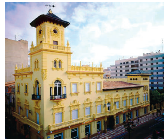
Edificio Casino Antiguo Castellón.